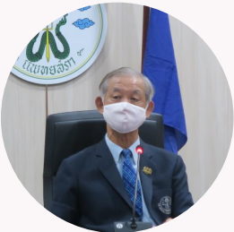
ศ.เกียรติคุณ นพ.อมร ลีลารัตน์

The Royal College of Anesthesiologists of Thailand