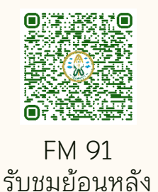
FM 91 รับชมย้อนหลัง

● รายการ FM 91 ก้าวทันโรคกับแพทยสภา สถานีวิทยุ สวพ.91 ➔ จำนวน 3 ตอน