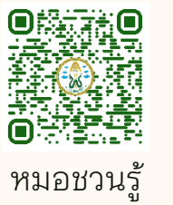
หมอขวนรู้

● บทความในโครงการหมอขวนรู้ โดยแพทยสภา ➔ จำนวน 2 บทความ