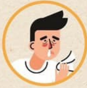
มีน้ำมูก