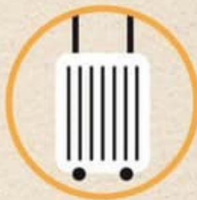
เพิ่งกลับจาก พื้นที่เสี่ยง

ถ้าเริ่มมีอาการเหล่านี้ภายใน 14 วัน หลังจากไปพื้นที่ระบาศที่ไ้รับการประกาศอย่างเป็นทางการ ควรรีบไปพบแพทย์