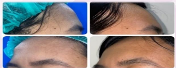
ภาพผู้ป่วยหลังผ่าตัดส่องกล้องเนื้องอกกระดูกบริเวณหน้าผาก