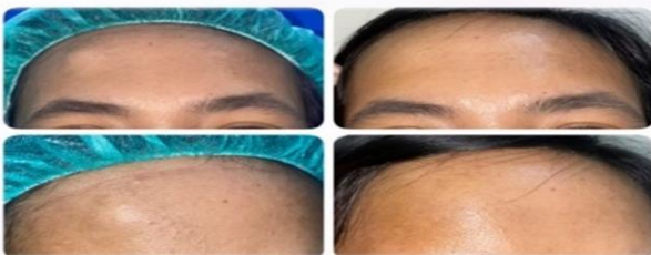
ภาพผู้ป่วยก่อนผ่าตัดเนื้องอกกระดูกบริเวณหน้าผาก