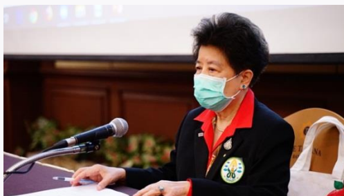
ศ.เกียรติคุณ พญ.สมศรี เผ่าสวัสดิ์ นายกแพทยสภา